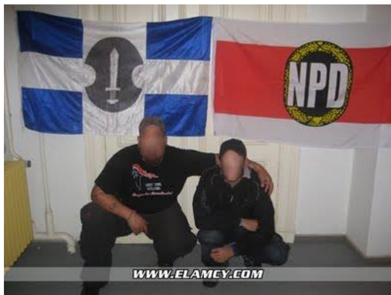
Επίσημη συνάντηση ΕΛΑΜ με το Γερμανικό νέο-νεοναζιστικό κόμμα NPD.